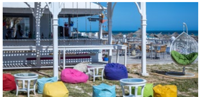
Beach Community Hub