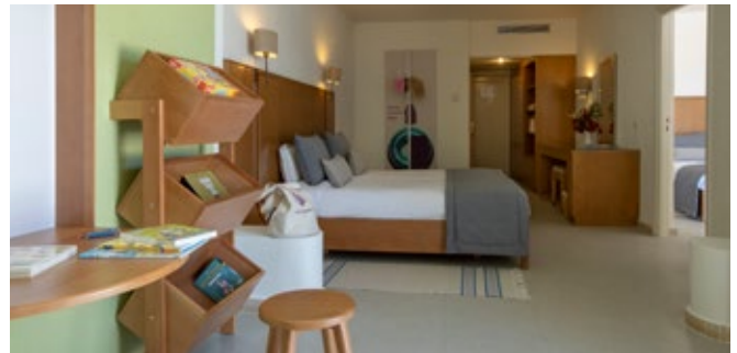
Calimera-Zimmer mit Kinderspielecke