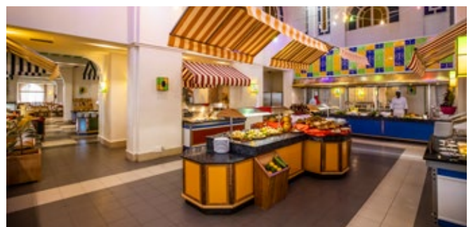
Restaurant mit Markt-Konzept