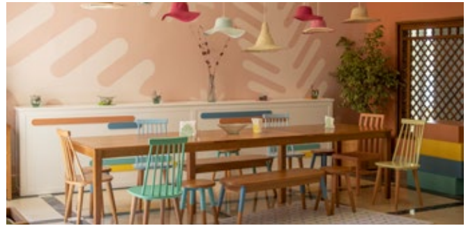
Lobby mit Community Table